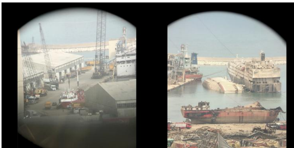
Lara Tabet et Randa Mirza. View from home #1 , 2020