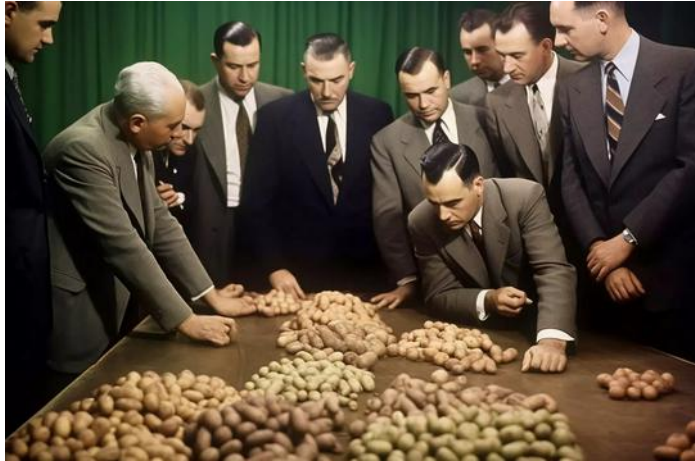
Les variétés de pommes de terre sélectionnées sont classées en seize catégories selon les normes de LURCH, 1952. Avec l'aimable autorisation de l'artiste.