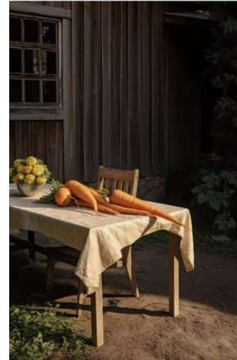
Table de ferme à Dengen, 1955. Avec l'aimable autorisation de l'artiste.