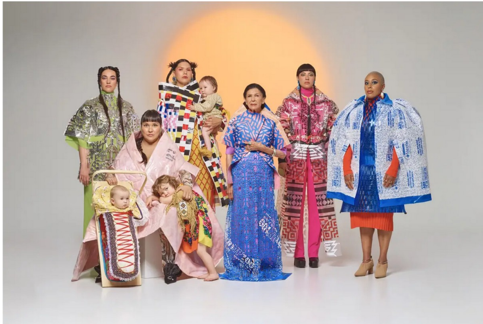
Échos d'un futur proche , 2022.